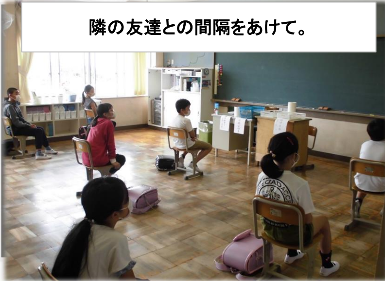
隣の友達との間隔をあけて。