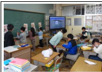
6年生への感謝を縦割りで話し合う1～5年生

令和5年度最後の月を迎えました。年度当初の学校だよりで校長からお知らせした方針『①子供たちの夢や志を育むこと ②夢や志を実現するために努力し、周りの人と協働する経験をさせること ③今ある方法にとらわれずよりよい方法を見出し、実行力を伸ばすことを実現するために、子供たち、保護者・地域の皆様、そして職員皆で考え、コロナ後の教育活動を創っていく年にしたい。』が、子供たちの頑張りや、保護者・地域の皆様のご協力により具現化されていることを、子供たちの生き生きとした表情から感じられるようになってきました。子供たち一人ひとりが夢や志をもち、来年度に期待を膨らませる学年末になるよう、職員一同尽力して参ります。