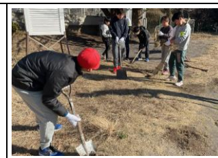
6年生「学校ピッカピカ」自分たちで考えて奉仕活動