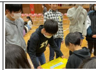
6年生に心を入れて作った寄せ書きをプレゼント