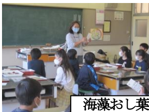
海藻おし葉教室（3年）