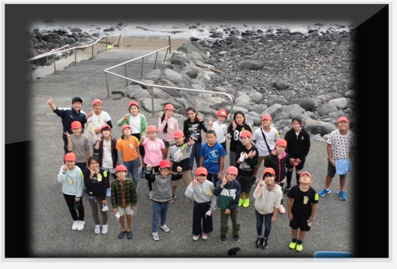
シュノーケリング体験の代わりとして行いました。魚を釣る体験もさせてもらうことができました。